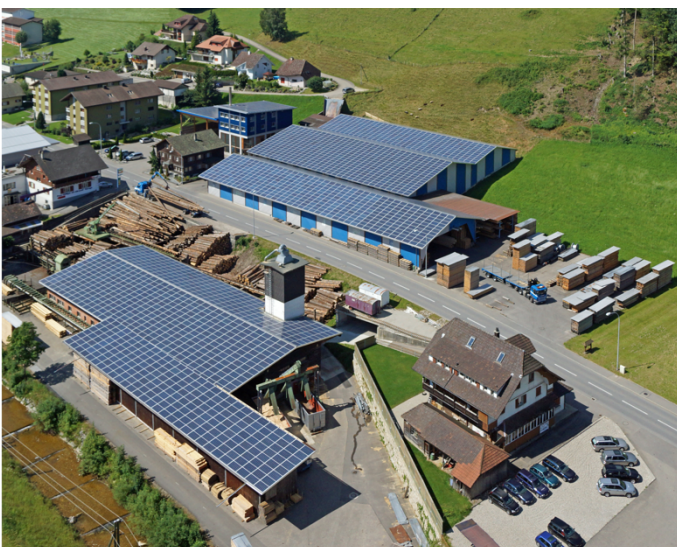
Ansicht des Sägewerks Christen in Luthern (Sägewerk Christen).

Weitere Informationen: saegewerkechristen.ch elektra-luthern.ch