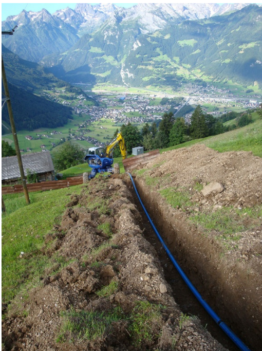
Verlegung der neuen Wasserleitungen auf der Eierschwand ( eierschwand.ch ).

Um die Probleme im Zusammenhang mit der Wasserversorgung zu lösen, bildeten die Grundeigentümer 2006 eine Interessensgemeinschaft und liessen eine Machbarkeitsstudie für eine gemeinsame Wasserversorgungsanlage erstellen. Das Projekt sah vor, anstelle einer aufwendigen Sanierung ein komplett neues System einzurichten. Aufgrund der landwirtschaftlichen Nutzung des Geländes standen für die Finanzierung des Vorhabens die Finanzhilfen im Rahmen der Strukturverbesserungsmassnahmen im Vordergrund. Allerdings erwiesen sich die Investitionskosten, die auf 3.15 Millionen Franken geschätzt wurden, wegen der anspruchsvollen topografischen Bedingungen als ausserordentlich hoch. Um das Projekt dennoch umsetzen zu können, beschlossen die Anwohner, eine Wasserversorgungsgenossenschaft ins Leben zu rufen und Kosten zu sparen, indem sie die Arbeiten – soweit möglich – selbst übernahmen.