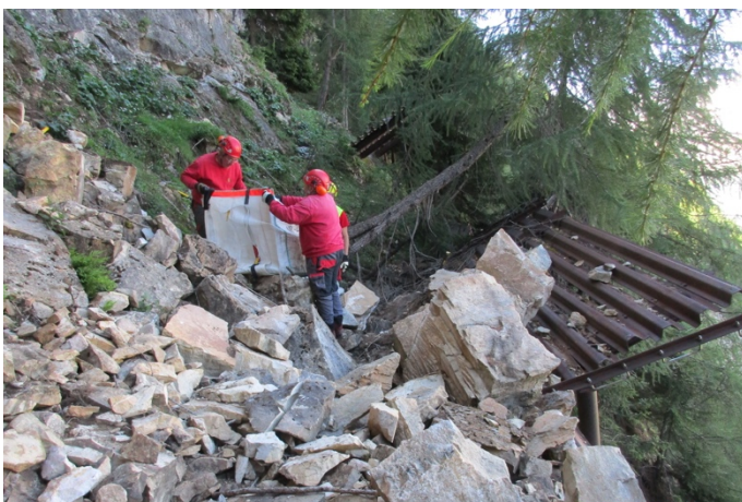
Instandsetzung von Lawinenverbauungen in der Nähe von Leukerbad (Forst Region Leuk).

Mit 7'800 Hektaren Wald ist die Forst Region Leuk derzeit der flächenmässig grösste Forstbetrieb des Kantons Wallis. Er entstand 2015 aus der Fusion der beiden Forstbetriebe Sonnenberg-Dala sowie Leuk und Umgebung. Mitglieder des Verbandes sind die Burgergemeinden Albinen, Gampel-Bratsch, Guttet-Feschel, Inden, Leuk, Leukerbad, Salgesch, Turtmann, Unterems und Varen, die entsprechenden Einwohnergemeinden sowie die Bergschaft Ems. Die interkommunale Zusammenarbeit erlaubt es, Synergien bei der Bewirtschaftung des Waldes und dem Unterhalt der Schutzbauten zu nutzen und Kompetenzen zu bündeln.