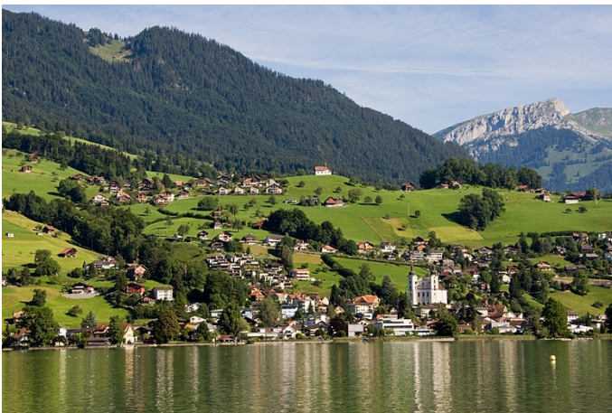
Ansicht der Gemeinde Sarnen.

Eine Hauptinspektion mit Zustandsbeurteilung findet alle 5 Jahre statt, je nach Relevanz des Bauwerks aber auch häufiger. Verwendet wird eine dreistufige Skala. Bei Schlüsselbauwerken ist klar, dass sie nie in den Zustand «kritisch» fallen dürfen. Als kritisch wird ein Objekt dann beurteilt, wenn sich die Fachleute nicht sicher sind, ob das Bauwerk bei einem Ereignis der kalkulierten Belastung noch standhält. Je nach Relevanz und Zustand der Baute wird entweder eine präventive, ereignisorientierte oder korrigierende Erhaltungsstrategie gewählt. Daraus leitet die Gemeinde jährlich die nötigen Sanierungsarbeiten ab.