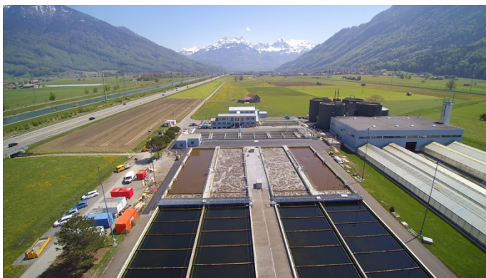
Ansicht der Kläranlage von Bilten (Abwasserverband Glarus).

Der Verband hat seither bewiesen, dass er sich neuen organisatorischen Anforderungen und dem Strukturwandel in der Industrie stets anpassen konnte. Mit dem Strukturwandel bei den angeschlossenen Industriebetrieben (Textilindustrie) musste die Anlagen verfahrenstechnisch angepasst werden. Neue Erkenntnisse aus der Abwasserforschung wurden bei der stetigen Modernisierung der Kläranlage schrittweise umgesetzt. So konnte die Anlage ihre Reinigungskapazität von 75'000 auf 105'000 Einwohnerwerte steigern, ohne dass neue Becken gebaut werden mussten. Somit hat die Anlage heute die Kapazität, neben dem normalen Wachstum der angeschlossenen Gemeinden das Abwasser weiterer Gemeinden in der Region zu reinigen. Neben der fortwährenden Anpassung der strategischen und organisatorischen Prioritäten stehen nun die nächsten technischen Projekte an.