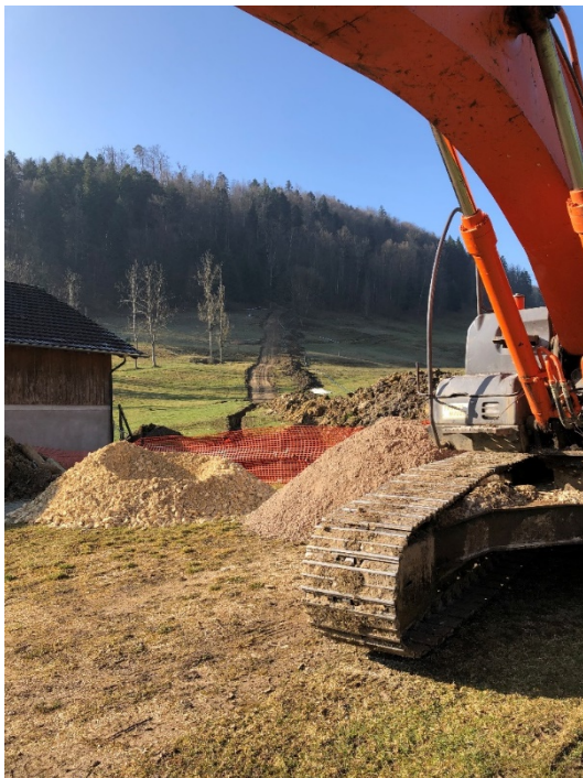
Grabungsarbeiten für die Verlegung der Strom- und Wasserleitung nach Lucelle (Gemeinde Pleigne).

Während Jahrzehnten bezogen die Bewohnerinnen und Bewohner der wenigen Häuser auf Schweizer Seite das Wasser aus einem behelfsmässigen Anschluss an das Versorgungsnetz im französischen Teil des Dorfes. Da diese gewohnheitsmässige Situation nie auf einer vertraglichen Basis geregelt wurde, bestanden verschiedene Unsicherheiten, namentlich in Bezug auf die zukünftige Entwicklung der Tarife oder die Auswirkungen einer möglichen Wasserknappheit auf die Versorgung. Zudem ergab sich eine Ungleichbehandlung gegenüber den anderen Bewohnern der Gemeinde Pleigne. Im Zug der Erneuerung der Stromnetze plante die BKW Energie AG 2017 die unterirdische Verlegung der Stromleitung nach Lucelle. Dafür waren aufwendige Grabungsarbeiten in einem topografisch schwierigen Gelände notwendig. Die Gemeinde nutzte die Gelegenheit und prüfte den Anschluss von Lucelle an die Trinkwasserversorgung von Pleigne. Im Rahmen einer Zusammenarbeit mit der BKW wurden schliesslich neben den Stromleitungen neue Wasserrohre verlegt. Dabei übernahm die Gemeinde die Mehrkosten, die sich aus den zusätzlichen Aushubarbeiten ergaben. In gleicher Weise nutzte ein privater Anbieter die Gelegenheit, um die Gebäude von Lucelle an das Glasfasernetz anzuschliessen.