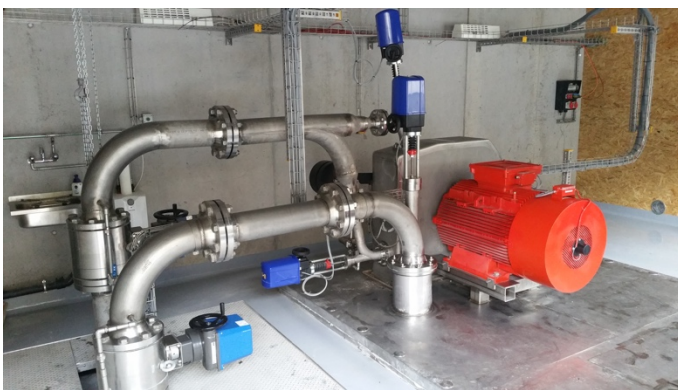
Abwasserkraftwerk Meiersboden, Churwalden (Rabiosa Energie).

Die Gemeinde beschloss, auf eine Sanierung der ARA zu verzichten und die Anschlussleitung an die ARA Chur zu errichten. Der Bau der neuen Druckleitung bot zudem die Gelegenheit, ein innovatives Projekt im Bereich der erneuerbaren Energieproduktion umzusetzen. Durch die Höhendifferenz von 500 Metern trifft das Abwasser aus Churwalden im Kanalisationsnetz der Stadt Chur mit einem Druck von rund 50 Bar ein. Dies hätte den Bau eines Energievernichtungsschachtes notwendig gemacht. Das Elektrizitätswerk der Gemeinde Churwalden traf Vorabklärungen zum Bau eines Abwasserkraftwerkes, um den hydrostatischen Druck für die Stromproduktion zu nutzen. Das Projekt wurde unter Einbezug der Bevölkerung konkretisiert und schliesslich auf der Grundlage einer Wassernutzungsvereinbarung zwischen der Gemeinde und dem Elektrizitätswerk umgesetzt. Es umfasst Anlagen für die mechanische Vorreinigung des Wassers in der ehemaligen ARA Churwalden und den Einbau