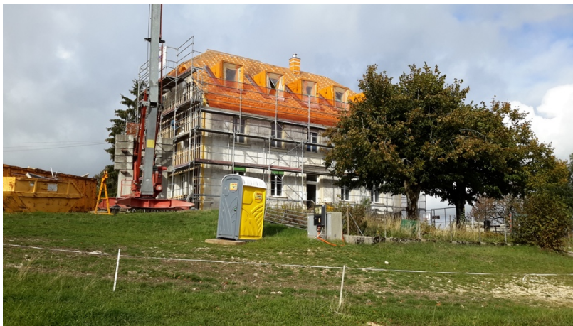
Sanierung der Schule von Pleigne (Gemeinde Pleigne).

Die Schule von Les Enfers ist nicht nur für Attraktivität des Dorfes für Familien mit Kindern von Bedeutung, sondern stellt auch einen sozialen Treffpunkt dar. Die Bildung eines Schulkreises mit der Nachbargemeinde Le Bémont ermöglichte es Les Enfers, die Schule trotz geringer Schülerzahlen zu erhalten. Das Engagement der Dorfgemeinschaft für die Schule kam auch bei der Sanierung des Gebäudes und der Suche nach entsprechenden Finanzierungsmöglichkeiten zum Ausdruck. Trotz Bundesbeiträgen aus dem Gebäudeprogramm, kantonalen Subventionen und einem Beitrag der Patenschaft Berggemeinden musste die Gemeinde einen grossen Teil der anfallenden Arbeiten aus eigenen Mitteln decken.