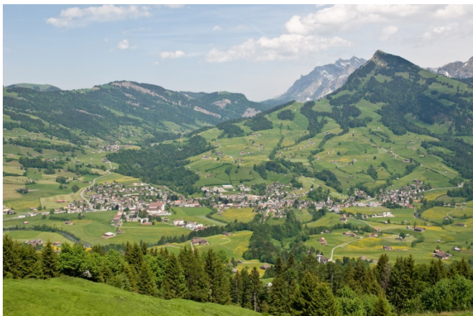
Der Dorfkern von Nesslau und Neu St. Johann im Toggenburg (Wikipedia).

Bis 2009 standen in Nesslau ebenso wie in anderen Gemeinden des Toggenburgs wegen der geringen Siedlungsdichte keine Kabelnetze für die Telekommunikation zur Verfügung. Zu diesem Zeitpunkt plante das Holzenergiezentrum Toggenburg (HEZT) in Nesslau den Aufbau einer Holzschnitzelheizung mit Fernwärmenetz. Bei der Ausführung der damit verbundenen Tiefbauarbeiten ergab sich die Möglichkeit, im Perimeter des Wärmeverbundes ohne grossen Aufwand Kabel für die Datenübertragung zu verlegen. In Zusammenarbeit mit dem HEZT und weiteren regionalen Partnern nutzten die Gemeindebehörden diese Gelegenheit, um ein Glasfasernetz zu realisieren. Da für die Datenübermittlung zum Wärmeverbrauch sowieso Leitungen zwischen