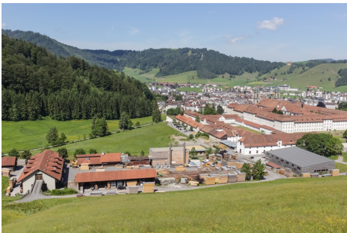
Das Kloster Einsiedeln mit der Heizanlage (Birchler Architektur AG, Einsiedeln).

Im Hinblick auf den Aufbau des Wärmeverbundes gründeten die Projektpartner 2016 den Energieverbund Einsiedeln. Dieser wird derzeit von drei Hauptaktionären sowie achtzig weiteren Aktionären aus der Region mitgetragen. Die Leitungsführung des Fernwärmenetzes wurde in Zusammenarbeit mit dem Bezirk Einsiedeln entwickelt. In einem ersten Schritt wurden das Kloster, drei anliegende Bezirksschulhäuser sowie einige Privatliegenschaften erschlossen. Die dafür notwendigen, 1.6 km langen Leitungen konnten nach kurzer Bauzeit im Herbst 2017 in Betrieb genommen werden. Eine Weiterentwicklung des Fernwärmenetzes ist sowohl in Richtung Ortskern wie auch durch private Hausanschlüsse möglich und wird derzeit umgesetzt. Als Standort für die Heizzentrale dient der Holzhof des Klosters Einsiedeln. Die Wärmeproduktion basiert auf der Verbrennung von Altholz, das beispielsweise bei Abbrüchen in der Region anfällt und vor der Gründung des Energieverbundes zur Entsorgung ins Ausland exportiert wurde. Auf diese Weise ergibt sich aus dem Projekt auch ein regionalwirtschaftlicher Mehrwert.