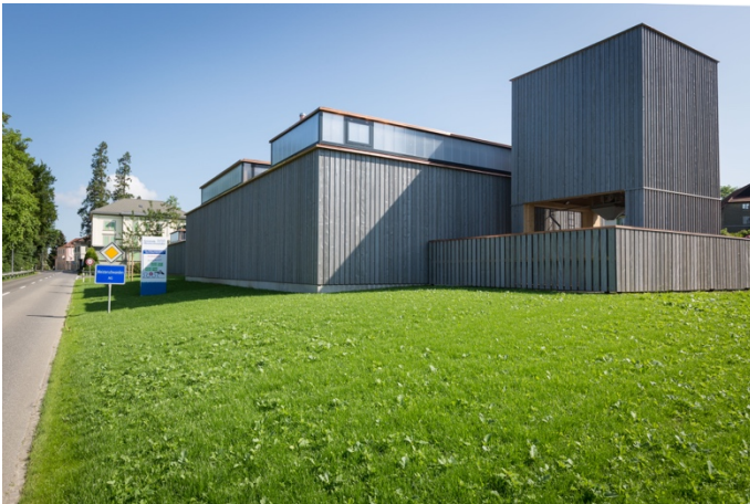
Werkhof Meisterschwanden (Gemeinde Meisterschwanden).

Bei den Zuschlagskriterien ist es möglich, beim Teilkriterium «Nachhaltigkeit» den Lieferanten von nachhaltigen, ökologischen und recycelbaren Baumaterialien mit einem tiefen Anteil an grauer Energie und geringen Treibhausgasemissionen eine maximale Punktzahl zu geben.