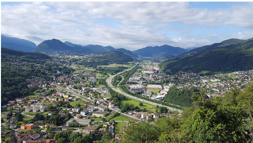
Blick auf Agno, Bioggio und Manna (Wikipedia).

Weitere Informationen: energia-abm.ch energie-region.ch