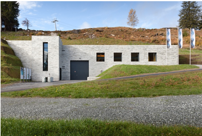
Wasser und Energiezentrale Punt Gronda (Flims Electric AG).

Neben der Koordination der Wasserkapazitäten für die verschiedenen Nutzungen überzeugt die Lösung auch bei der Nutzung des Wassers für die Produktion von erneuerbarem Strom: Von der Quelle des Flimser Trinkwassers bis zu seiner Rückführung nach der Kläranlage in den Fluss wird das Wasser vier Mal zur elektrischen Energiegewinnung genutzt. Mit dem gewonnenen Strom können 650 Haushalte mit CO 2 -frei produzierter Elektrizität versorgt werden.