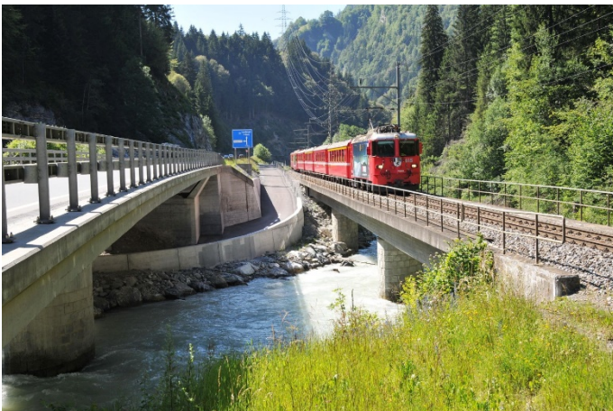
Veloweg zwischen Fideris und Dalvazza im Prättigau (Pro Velo).