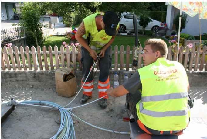
Verlegung des Glasfasernetzes im Oberwallis (DANET AG).

Das DANET-Projekt umfasst die Erschliessung sämtlicher dauernd genutzter Wohnungen und Geschäfte in den Bauzonen der Oberwalliser Gemeinden mit leistungsfähigen FTTH-Anschlüssen («Fiber to the home»). Die Netzgesellschaft gehört den Oberwalliser Gemeinden und ist rechtlicher Vertrags- und Kooperationspartner der Swisscom. Der Aufbau des Glasfasernetzes, dessen Kosten auf rund 200 Millionen Franken geschätzt wird, erfolgt in einer Baupartnerschaft zwischen der DANET und der Swisscom. Die lokalen Energieversorgungsunternehmen sind ebenfalls in die Arbeiten eingebunden. Das Aktienkapital der DANET besteht aus einem Sockelbeitrag von 50 Franken pro Einwohner, den sämtliche Gemeinden bei der Gründung der Gesellschaft leisteten. Unabhängig von ihrer geografischen Lage zahlen die Gemeinden bei Erschliessungsbeginn einen weiteren Beitrag von 350 Franken pro Einwohner. Das Finanzierungsmodell beruht auf dem Solidaritätsgedanken, da die tatsächlichen Kosten in den städtischen Talgemeinden deutlich tiefer liegen als in den Berggemeinden.