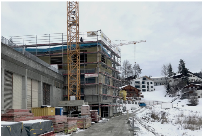
Sanierung des Hallenbades in Laax und Bau des neuen Wellnesshostels (SSA Architekten).

Gemäss dem gewählten Modell der Zusammenarbeit tritt die Gemeinde Laax als Bauherrin auf. Die Investitionskosten für die Umsetzung des Projekts belaufen sich auf 16.25 Millionen Franken. Diese werden hauptsächlich von der Gemeinde getragen. Als systemrelevante Infrastruktur unterstützt der Kanton Graubünden das Projekt mit 1 Million Franken sowie mit einem Äquivalenzbeitrag zum Bundesdarlehen im Rahmen der