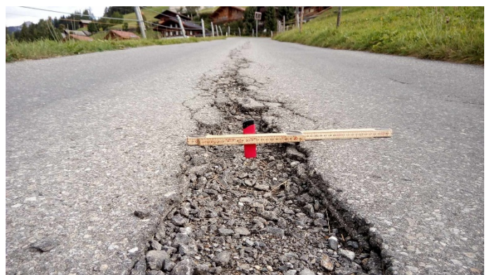
Dokumentation von Strassenschäden (Roland Christen, InfraTrace).

In der Gemeinde Lenk hat die digitale Dokumentation neben Effizienzgewinnen in der Zustandserfassung und im Datenmanagement auch die langfristige Planung der Unterhaltsarbeiten vereinfacht. Die Inspektionsdaten ermöglichen es, mit einem geringen Aufwand diejenigen Strassenabschnitte zu identifizieren, die in den nächsten Jahren saniert werden müssen, und eine entsprechende Kostenschätzung zu generieren. Im Sinne einer «rollenden Planung» können die einzelnen Vorhaben entsprechend der verfügbaren Mittel optimal verteilt und in die langfristige Finanzplanung aufgenommen werden. Die Verwendung der digitalen Technologie stärkt damit auch die Entscheidungsgrundlagen der Gemeinde im Infrastrukturmanagement.