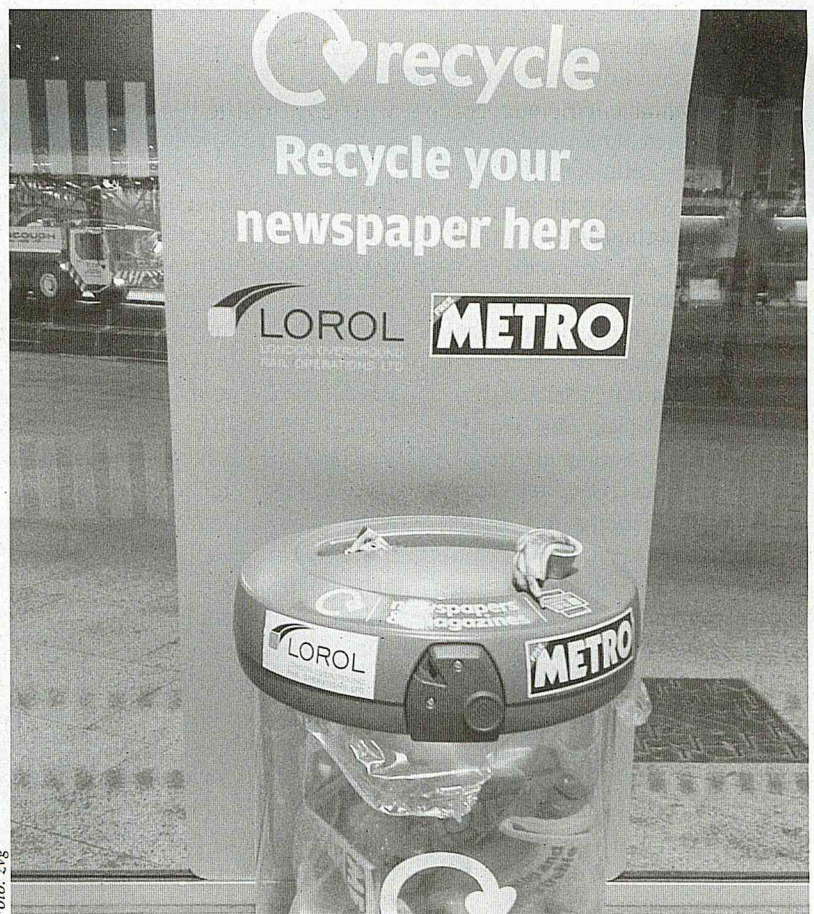
Von BAFU gewünscht, anderswo Realität: Rücknahmesystem für Pendlerblätter.